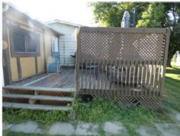
Arrière du bâtiment