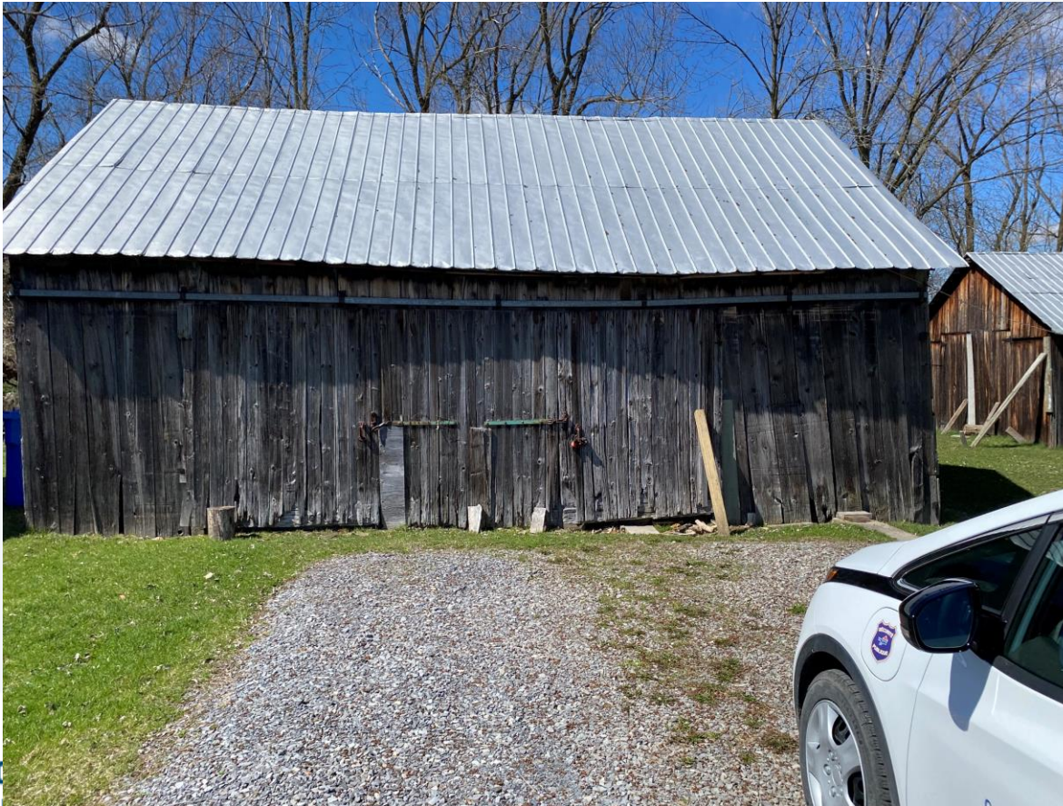
Hangar no 1