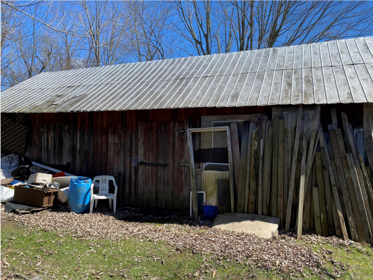
Hangar no 2