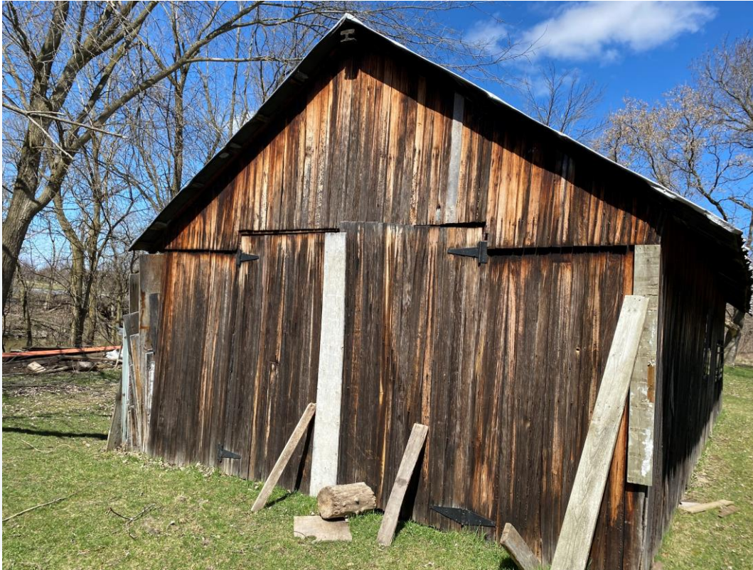
Hangar no 2