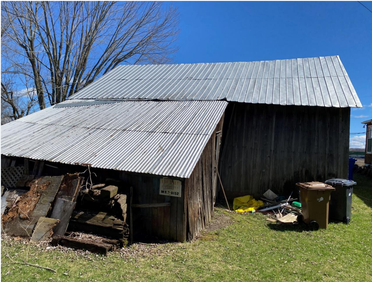
Hangar no 1